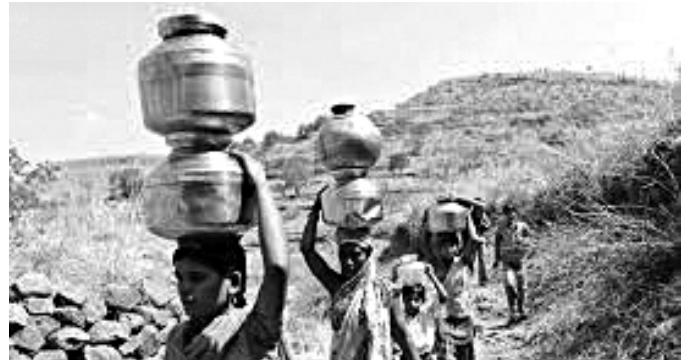
तथापिचा जिल्हाळा/अंक ४१, ऑक्टोबर-डिसेंबर २०१५

जिल्ह्यात ग्रामीण मजुरांना काम नाही. जास्तीत जास्त लोक शहरांकडे स्थलांतर करत आहेत. यामध्ये लहान मुलं आणि महिलांची फरपट होत आहे. बोअरवेललाही पाणी नाही, इतकी पाण्याची पातळी खाली गेली आहे. विहिरींमध्येही पाणी खोलवर गेले आहे. हे पाणी आणण्यासाठीही महिलांना दूर जावे लागते.