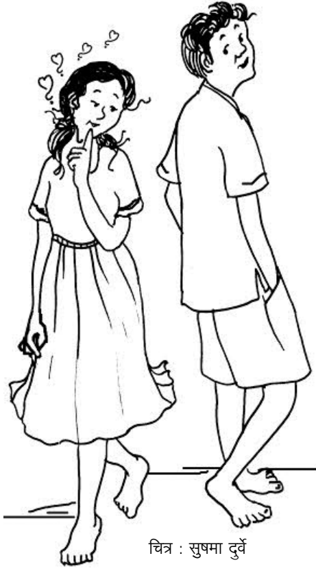
चित्र : सुषमा दुर्वे

यासाठी शाळा काय करू शकते? तर शाळा आपल्या आवाक्यातील परिस्थिती बदलण्याचा प्रयत्न करू शकते. समाजातील वातावरण, प्रसार माध्यमे याबाबत शाळेची तशी काही भूमिका नसली तरी कौटुंबिक वातावरण योग्य राहण्यासाठी शाळेमार्फत पालकांना मार्गदर्शन करता येईल. मुलांचे वर्तन अधिक जबाबदार किंवा अपेक्षित सामाजिक नियमांरूप घडवून आणण्याच्या दिशेने शाळा पातळीवर काही कार्यक्रम राबवता येतील. मुलांनी मुलींना चिडवणे, एकमेकांना खाणाखुणा करणे, एकमेकांचं साहित्य लपवणे, कागदावर किंवा भिंतीवर एकमेकांची नावं लिहिणे, एकमेकांना स्पर्श करणे, ढकलणे; अशा प्रकारच्या कृती मुलं-मुली विशेषतः वयात आलेली मुलं-मुली करतात. अशा वेळेस त्यांना अपमानित न करता किंवा त्यांच्या स्व प्रतिमेला तडा जाईल अशा प्रकारची शेरबाजी न करता कौशल्याने असे प्रसंग हाताळावेत. कारण वयात येताना होणाऱ्या बदलांचा आविष्कार त्यांच्या वागण्यातून घडत असतो. आपण एक शिक्षक म्हणून याकडे सकारात्मक दृष्टीकोनातून आणि जबाबदारीने पहाणे गरजेचे असते. एखाद्या वर्तनाचा जर अतिरेक होत असेल तर शाळा पातळीवर काही सुधारणा कार्यक्रम राबवावेत. उदाहरणार्थ, मुला-मुलींचे एकत्रित खेळ, प्रश्नंजुषा, कोडी, आवडता गृहपाठ देणे, एकत्रितपणे मातीकाम, कोलाज काम, चित्रकला, डान्स असे उपक्रम घेता येतील, मुला-मुलींचा गप्पांचे अनौपचारिक कार्यक्रमही घेता येतील. यामुळे मोकळेपणाचे वातावरण निर्माण होऊन मुला-मुलींच्या वर्तनामध्ये सकारात्मक बदल घडून येण्यास मदत होईल.