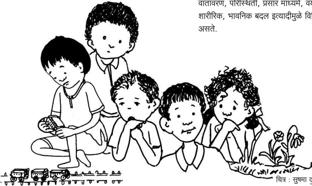
चित्र : सुषमा दुर्वे

आधुनिक विचार प्रवाहानुसार मुलांच्या अशा वर्तनाकडे समस्या म्हणून न पाहता एक वर्तन अवस्था म्हणून पाहणे गरजेचे आहे. समस्या म्हटलं की आपोआपच नकारात्मक दृष्टीकोन येतो. त्यामुळे विद्यार्थ्यांच्या प्रगतीमध्ये अडथळा येण्याची शक्यता असते. मुला-मुलींच्या वर्तनामागे अनेक कारणे असतात. आजूबाजूचे वातावरण, परिस्थिती, प्रसार माध्यमे, वयानुसार मुलांमध्ये होणारे शारीरिक, भावनिक बदल इत्यादीमुळे विविध प्रकारचे वर्तन घडत असते.